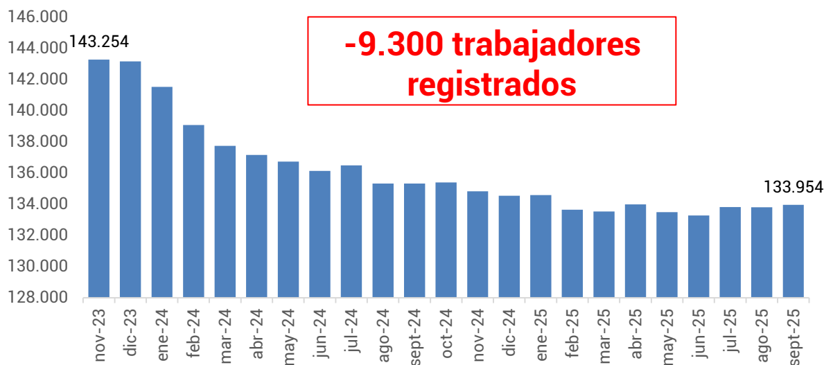
Gráfico 2. Evolución de la cantidad de trabajadores. Período: noviembre 2023 – septiembre 2025

Por otro lado, en el mismo período, la cantidad de trabajadores/as registrados/as se redujo 6,5%, lo que representa una pérdida de 9.300 puestos de trabajo, al pasar de 143.254 en noviembre de 2023 a 133.954 en septiembre de 2025.